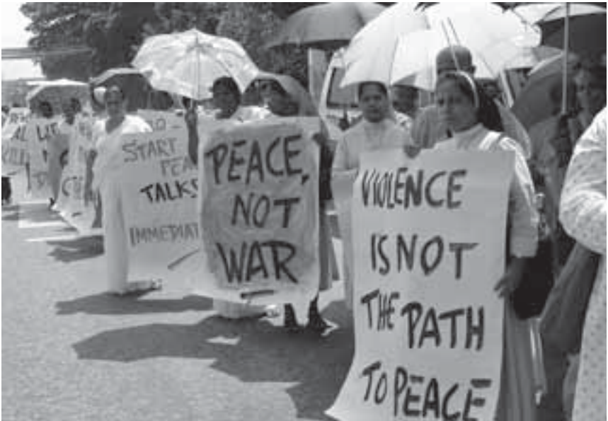
Perempuan menuntut dialog selama sebuah demonstrasi menentang perang di Kolombo, 23 Januari, 2006. Pemberontak Macan Tamil diduga telah menyerang dan membunuh tiga orang tentara di bagian timur beberapa hari sebelumnya, ketika perantara perdamaian Nowergia masuk untuk memulai sebuah upaya terakhir untuk mencegah terjadinya kembali perang sipil.

rapuh dan tidak dapat menjadi satu-satunya cara untuk melindungi kepentingan perempuan. Mereka tidak dapat dianggap sebagai pengganti bagi mobilisasi perempuan yang aktif dan independen dan lobi yang terus-menerus untuk proses representatif dan inklusi yang menghormati dan menjamin hak-hak asasi manusia dan demokrasi dan menjamin penciptaan perdamaian yang berkelanjutan dan transformatif.