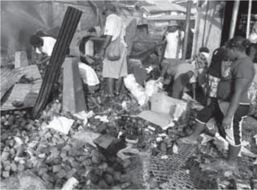
Warga mencari makanan kaleng yang dapat digunakan dari sebuah toko yang dirusak di Daerah Pecinan di Honiara, 20 April 2006, dimana hanya sepuluh persen dari bangunan yang tidak terbakar mengikuti kerusuhan dan huru-hara setelah pemilihan nasional.

atau mengancam penyalahgunaan. Pendekatan ini berkontribusi terhadap pencegahan jangka panjang dengan mengurangi kemungkinan kekerasan, mempromosikan keadilan sosial dan hak asasi manusia dan memajukan keamanan komunitas yang luas. 124