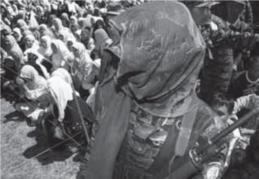
Seorang pejuang Front Pembebasan Islam Moro memisahkan perempuan dari laki-laki selama sebuah pertemuan di kelompok Camp Bushra, Mindanao, Maret 2008.

kami dapat memobilisasi ibu-ibu dan menamai kampanye tersebut , 'Mothers for Peace' . Setelah diskusi yang panjang tentang apakah kami seharusnya menggunakan istilah “perempuan” atau “ibu”, kami sengaja memilih kata dengan kekuatan emosional yang lebih besar tetapi tidak terlalu “mengancam”. Kami menghubungi jaringan kami dan mendapatkan respon yang besar dari peorangan maupun kelompok di seluruh negara ini. Diluncurkan pada Hari Ibu (11 Mei), kampanye tersebut menuntut gencatan senjata segera dan kembali ke meja perundingan. Hal tersebut secara efektif membentuk opini publik lewat pertemuan tatap muka antara perempuan dari Mindanao dan dari daerah lainnya di Filipina yang diliput secara baik oleh media nasional. 38 Tiga perempuan yang telah melarikan diri dari rumah mereka dan sekarang tinggal di pusat-pusat evakuasi dibawa untuk bertemu dengan perempuan lain di kota-kota besar di negeri ini. Pada pertemuan-pertemuan ini, ribuan perempuan mendengarkan perempuan dari Mindanao menggambarkan rasa sakit dan kesulitan kehidupan mereka sebagai akibat dari pengungsian yang berkelanjutan. “Saya tidak bahwa