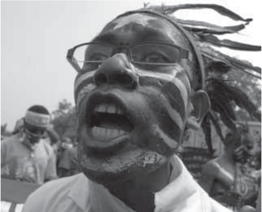
Perempuan Papua berdemonstrasi untuk otonomi yang lebih luas, di Jakarta.