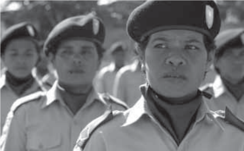
Petugas polisi perempuan berbaris selama upacara ulang tahun kepolisian nasional yang kedua di Dili, Sabtu, 27 Maret, 2004.

“ditawari pilihan untuk bergabung dengan pasukan keamanan Timor Timur yang baru; mereka yang menolak, menerima uang setara 100 dolar Amerika bersama dengan pelatihan bahasa dan komputer. Tidak sebanding dengan apa yang ditawarkan kepada perempuan yang telah berfungsi sebagai pendukung sepanjang perjuangan.” 78